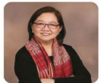
Pia de Leon St. Clare Catholic Church

Topic: "Jesus, the Community Organizer: Building the Kingdom of Love, Peace and Justice."