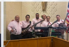
ALABANZA: FUEGO NUEVO