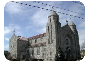
Holy Trinity Church 315 Lawrie Street