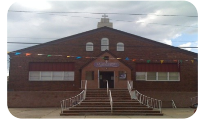
La Asuncion Church 777 Cortland Street Parish Office/Oficina Principal