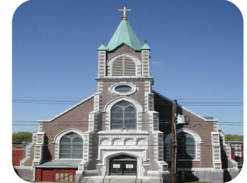
Our Lady of Hungary Church 697 Cortlandt St