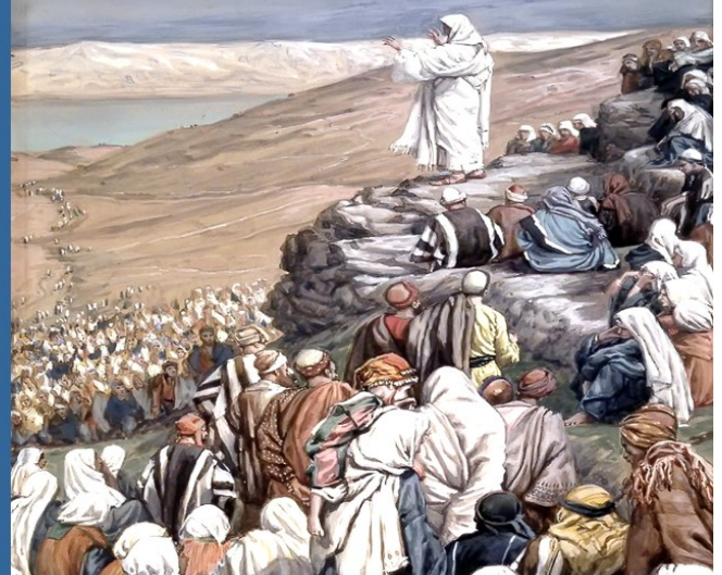
“Le Sermon Sur La Montagne”, James Tissot. Public Domain

We the faith community of Immaculate Conception, empowered by our Baptism, commit ourselves to live the Gospel message. Affirmed through the grace of our Eucharistic celebrations, it is our vision to reach out lovingly in prayer, formation and service.