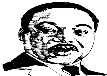
Martin Luther King, Jr.