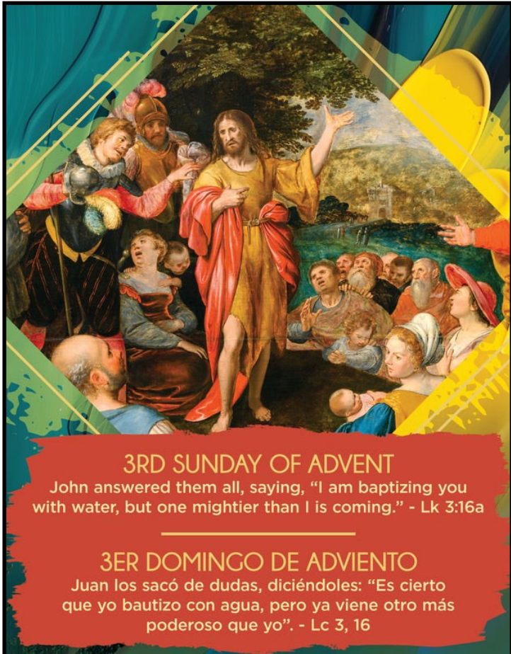
Excerpts from the Lectionary for Mass ©2001, 1986, 1970 CCD. Leccionario II © 1987 Comisión Episcopal de Pastoral Litúrgica de la Conferencia del Episcopado Mexicano. CLP