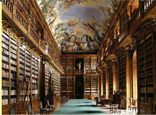
Biblioteca di Strahov I, Praga